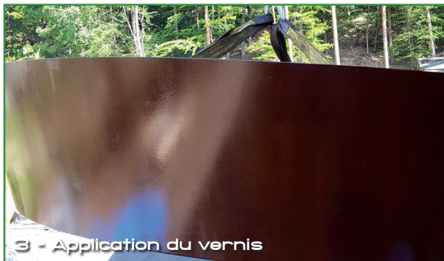
3 - Application du vernis