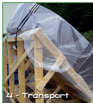
4 - Transport