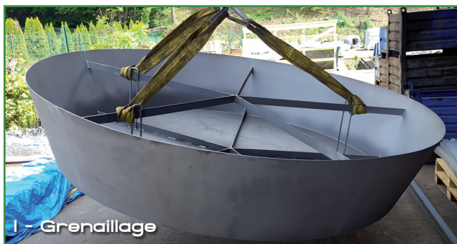
1 - Grenailage

Nous réalisons et installons des bacs sur-mesure de A à Z