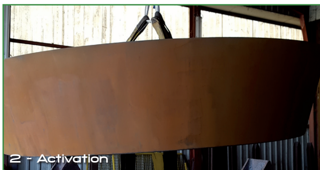
2 - Activation