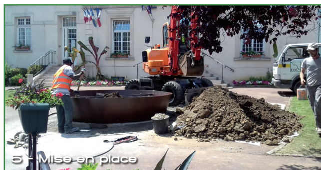
5 - Mise en place